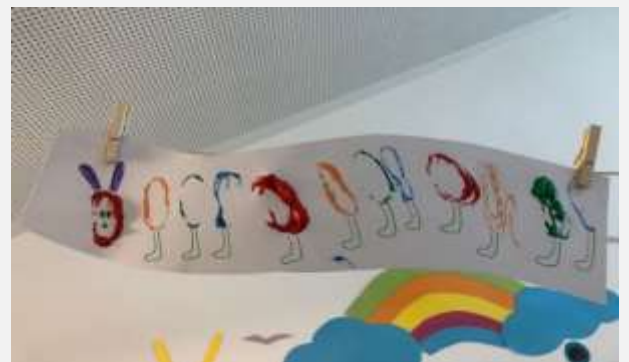
Unsere Raupe Nimmersatt

Wir wünschen allen Familien eine sonnige Zeit.